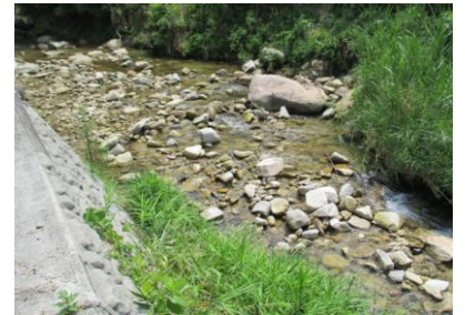
農園そばの府中大川