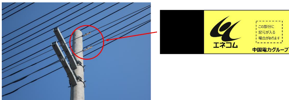
図2 ケーブル標示札の例