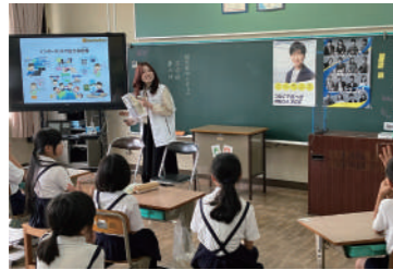
インターネットの安心・安全な使い方講座の様子

大きな災害に備えて保存食や飲料水を備蓄しており、社会貢献およびフードロス削減を目的に、入替時に賞味期限に余裕のある備蓄品を地域のNPO法人へ寄贈しています。