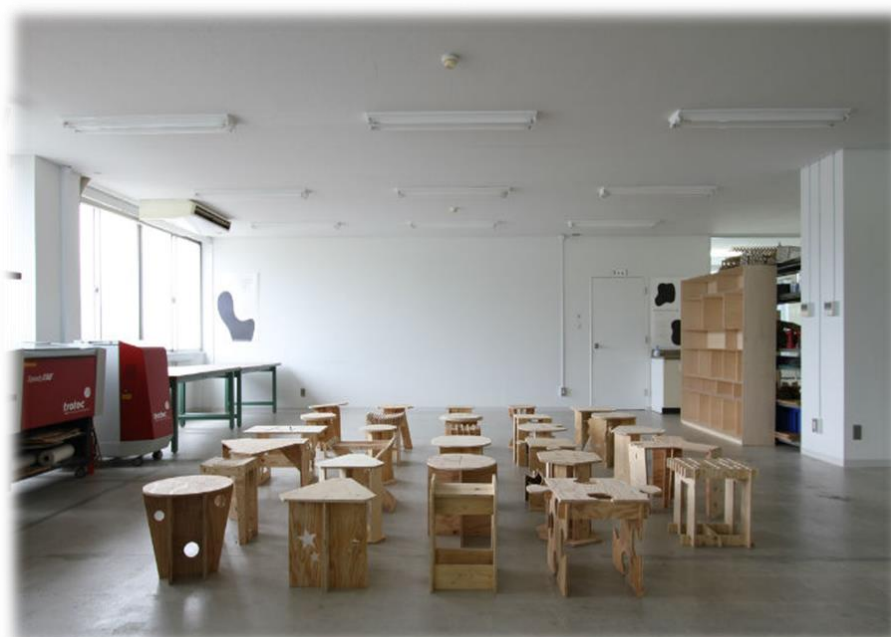
広島工業大学内「デジタルファブリケーションラボ」