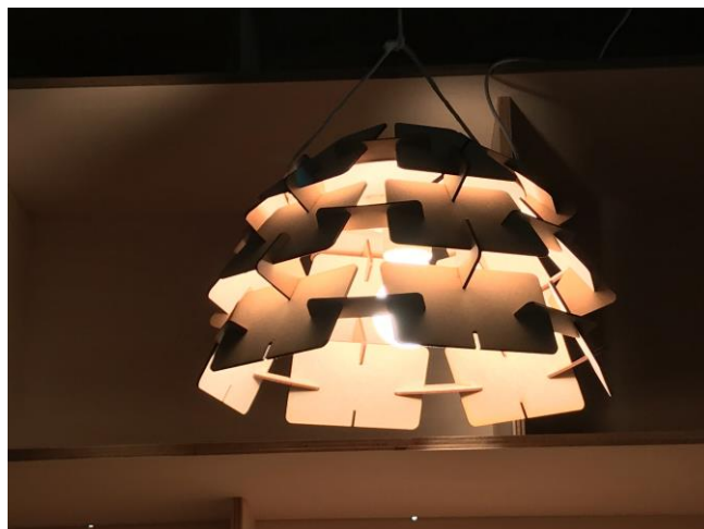
完成品イメージ（デザインの一例）